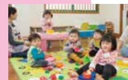
院内保育施設「にっここ保育園」